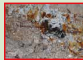
Assen uit kachel, open haard of barbecue WEL restafval

Vinden de compostwormen de weg naar je tuin niet, dan zorgt IGEAN ervoor dat het GFT+ bij je thuis wordt opgehaald. Het groente, fruit- en klein tuinafval wordt samen met het niet-recycleerbaar papier zoals papieren servetten, papieren koffiefilters en slagerspapier in de installaties van IGEAN te Brecht verwerkt tot compost en groene stroom. De kwaliteit van de compost hangt niet alleen af van het verwerkingsproces, maar vooral van de kwaliteit van het aangeboden GFT+. Het is dus belangrijk dat je goed sorteert! Alleen op die manier kan de IGEAN-compost bekroond blijven met het Vlaco-label. Dit label verzekert dat de compost voldoet aan de hoogste kwaliteitseisen. Volgende zaken vinden we spijtig genoeg ook in het GFT+ terug. Ze horen er echter niet in thuis.