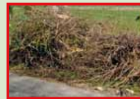
Groot en niet verhakseld tuinafval WEL groenafval op het containerpark