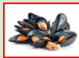
Mosselschelpen WEL restafval