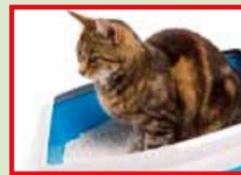
Kattenbakvulling WEL restafval

Je vindt de sorteerregels van het GFT+ op www.igean.be en op je ophaalkalender!