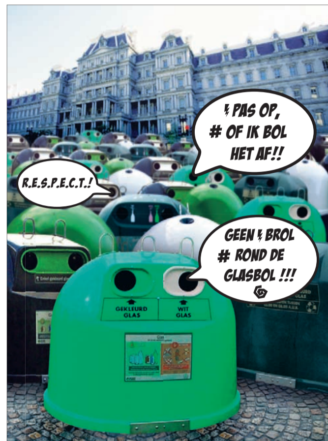
Verbolgen glasbollen in Brussel. De betoging verliep zonder noemenswaardige incidenten.